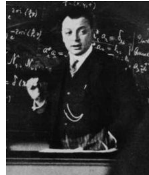
Wolfgang Ernst Pauli (1900 - 1958)

rang de simple théorème, le remarquable "théorème spin-statistique". Les particules quantiques, outre les degrés de liberté d'espace et de temps, ont un degré de liberté supplémentaire, interne, appelé "spin". Ce spin contrairement aux coordonnées d'espace et de temps ne varie pas continuellement, mais prends les valeurs: -S, -S + 1, -S + 2, \dots, +S - 1, +S , où S est un entier, ou un demi-entier (entier divisé par deux). Le théorème de Pauli montre que les particules de spin demi-entier sont nécessairement des fermions, et donc ont une fonction d'onde élément d'une algèbre extérieure.