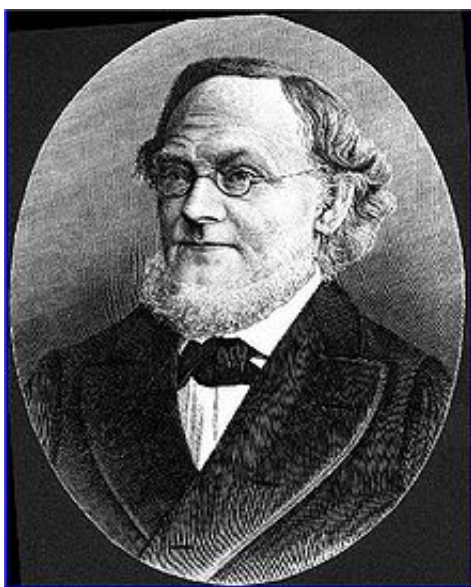
Hermann G. Grassmann (1809 - 1877)

L'algèbre de Grassmann ou "algèbre extérieure d'un espace vectoriel" est une algèbre un peu inhabituelle car son produit, appelé "produit de Grassmann" ou "produit extérieur" et noté \wedge , est non-commutatif, c'est-à-dire que a \wedge b n'est pas nécessairement égal à b \wedge a , pour deux éléments a et b de cette algèbre. En fait, si E désigne l'espace vectoriel à partir duquel on va construire l'algèbre extérieure, et si \vec{x}_1, \vec{x}_2 sont deux vecteurs de E , on a la relation,