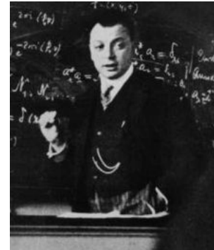
Wolfgang Ernst Pauli (1900 - 1958)

rang de simple théorème, le remarquable "théorème spin-statistique". Les particules quantiques, outre les degrés de liberté d'espace et de temps, ont un degré de liberté supplémentaire, interne, appelé "spin". Ce spin contrairement aux coordonnées d'espace et de temps ne varie pas continuellement, mais prends les valeurs: -S, -S + 1, -S + 2, \dots, +S - 1, +S , où S est un entier, ou un demi-entier (entier divisé par deux). Le théorème de Pauli montre que les particules de spin demi-entier sont nécessairement des fermions, et donc ont une fonction d'onde élément d'une algèbre extérieure.