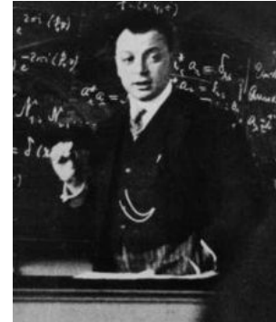
Wolfgang Ernst Pauli (1900 - 1958)

rang de simple théorème, le remarquable "théorème spin-statistique". Les particules quantiques, outre les degrés de liberté d'espace et de temps, ont un degré de liberté supplémentaire, interne, appelé "spin". Ce spin contrairement aux coordonnées d'espace et de temps ne varie pas continuellement, mais prends les valeurs: -S, -S + 1, -S + 2, \dots, +S - 1, +S , où S est un entier, ou un demi-entier (entier divisé par deux). Le théorème de Pauli montre que les particules de spin demi-entier sont nécessairement des fermions, et donc ont une fonction d'onde élément d'une algèbre extérieure.