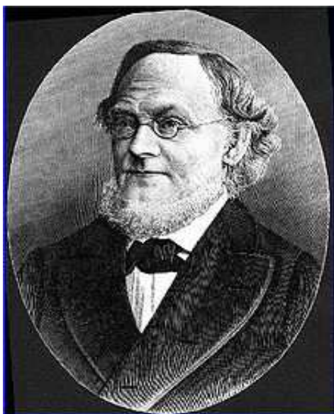
Hermann G. Grassmann (1809 - 1877)

L'algèbre de Grassmann ou "algèbre extérieure d'un espace vectoriel" est une algèbre un peu inhabituelle car son produit, appelé "produit de Grassmann" ou "produit extérieur" et noté \wedge , est non-commutatif, c'est-à-dire que a \wedge b n'est pas nécessairement égal à b \wedge a , pour deux éléments a et b de cette algèbre. En fait, si E désigne l'espace vectoriel à partir duquel on va construire l'algèbre extérieure, et si \vec{x}_1, \vec{x}_2 sont deux vecteurs de E , on a la relation,