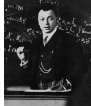
Wolfgang Ernst Pauli (1900 - 1958)

rang de simple théorème, le remarquable "théorème spin-statistique". Les particules quantiques, outre les degrés de liberté d'espace et de temps, ont un degré de liberté supplémentaire, interne, appelé "spin". Ce spin contrairement aux coordonnées d'espace et de temps ne varie pas continuellement, mais prends les valeurs: -S, -S + 1, -S + 2, \dots, +S - 1, +S , où S est un entier, ou un demi-entier (entier divisé par deux). Le théorème de Pauli montre que les particules de spin demi-entier sont nécessairement des fermions, et donc ont une fonction d'onde élément d'une algèbre extérieure.